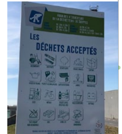
PANNEAU D'ENTRÉE DE LA DÉCHÈTERIE DE SUIPPES