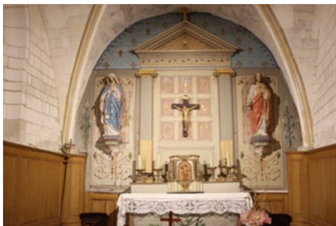
ÉGLISE DE TILLOY-ET-BELLAY

Dans cet optique, des travaux d'électricité ont été réalisés dans les églises de Tilloy-et-Bellay et Sainte-Marie-à-Py. Ces travaux ont consisté en la dépose des cables et appareillages non conformes et la réalisation de nouveaux câblages, appareillages électriques et éclairages intérieurs.