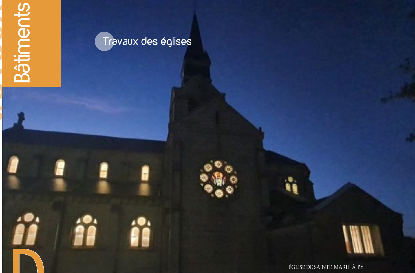
ÉGLISE DE SAINTE-MARIE-À-PY

D ans le cadre de l'entretien de son patrimoine, la Communauté de Communes de la Région de Suippes a entrepris un programme de pérennisation de ses églises.