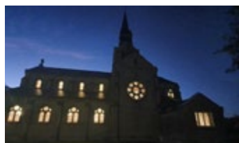
Bâtiments Rénovation des églises > lire p12