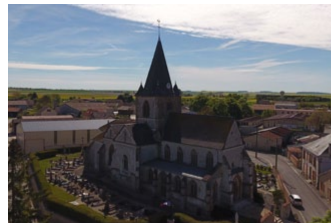
RESTAURATION DU CLOCHER DE L'ÉGLISE DE SOMME-SUIPPE

Ces travaux auront lieu à l'automne pour l'église de Somme-Tourbe et au printemps prochain pour les deux autres églises.