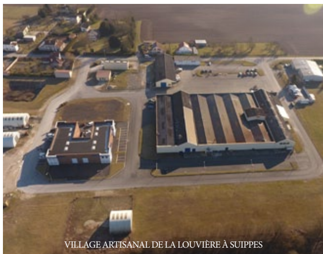
VILLAGE ARTISANAL DE LA LOUVIÈRE À SUIPPES

En application des mesures gouvernementales, chaque entreprise locataire des zones d'activités communautaires de la Louvière (Suippes) et de la Cressonnière (Somme-Suippe) s'est vue proposer un report de loyers, qui n'a été que très peu sollicité.