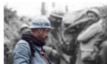
Marne 14-18 Demandez le programme ! > lire p18