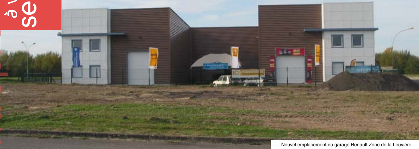
Nouvel emplacement du garage Renault Zone de la Louvière