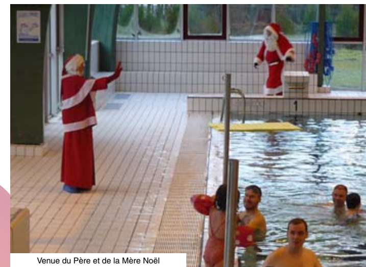
Venue du Père et de la Mère Noël

Le samedi 13 décembre 2014, la piscine intercommunale de Suippes recevra la visite du Père Noël lors de la séance d'éveil aquatique de 9h à 11h30. A cette occasion, un goûter avec le Père Noël et la Mère Noël sera organisé ainsi qu'une distribution de bonbons et de cadeaux. Merci à nos partenaires Mc Donald's et Coup'coiff mixte.