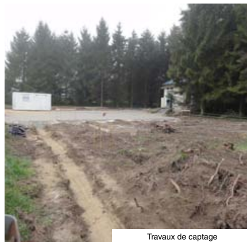
Travaux de captage

Le financement global de l'opération se décompose en subventions, dont 20% du Conseil Général, 28% de l'Agence de l'Eau Seine-Normandie, en récupération de la TVA pour un peu plus de 18% et en fonds propres de la Communauté de Communes pour 34%.