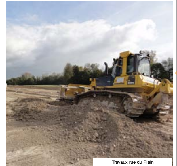
Travaux rue du Plain

L'investissement global de l'opération représente un montant de près de 1 000 000.00 € TTC, dont 12% seront pris en charge par la Communauté de Communes, hors subventions et récupération de TVA. Les travaux sont financés par les propriétaires fonciers dans le cadre de l'AFUA.