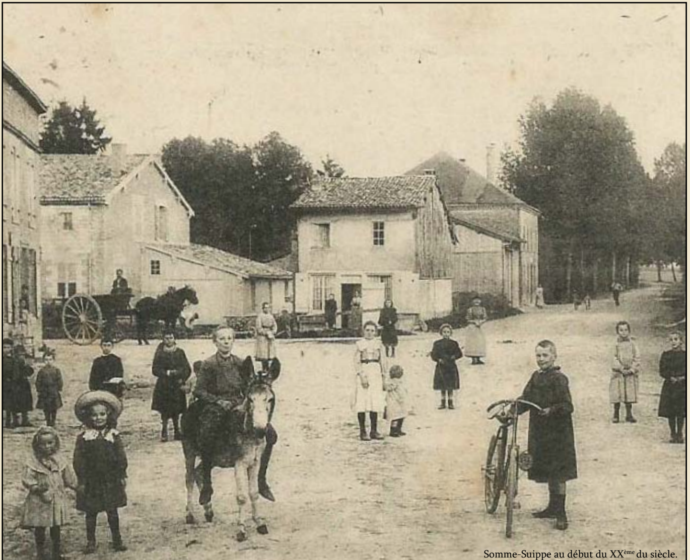
Somme-Suippe au début du XX ème du siècle.

nos communes avant 1914. A l'aide d'arrêtés communaux et de témoignages d'habitants nous sommes parvenus à trouver quelques anecdotes réelles, toutes placées dans la période de 1890 à 1913. Voici donc à quoi auraient pu ressembler nos Echos de l'Interco à l'époque!