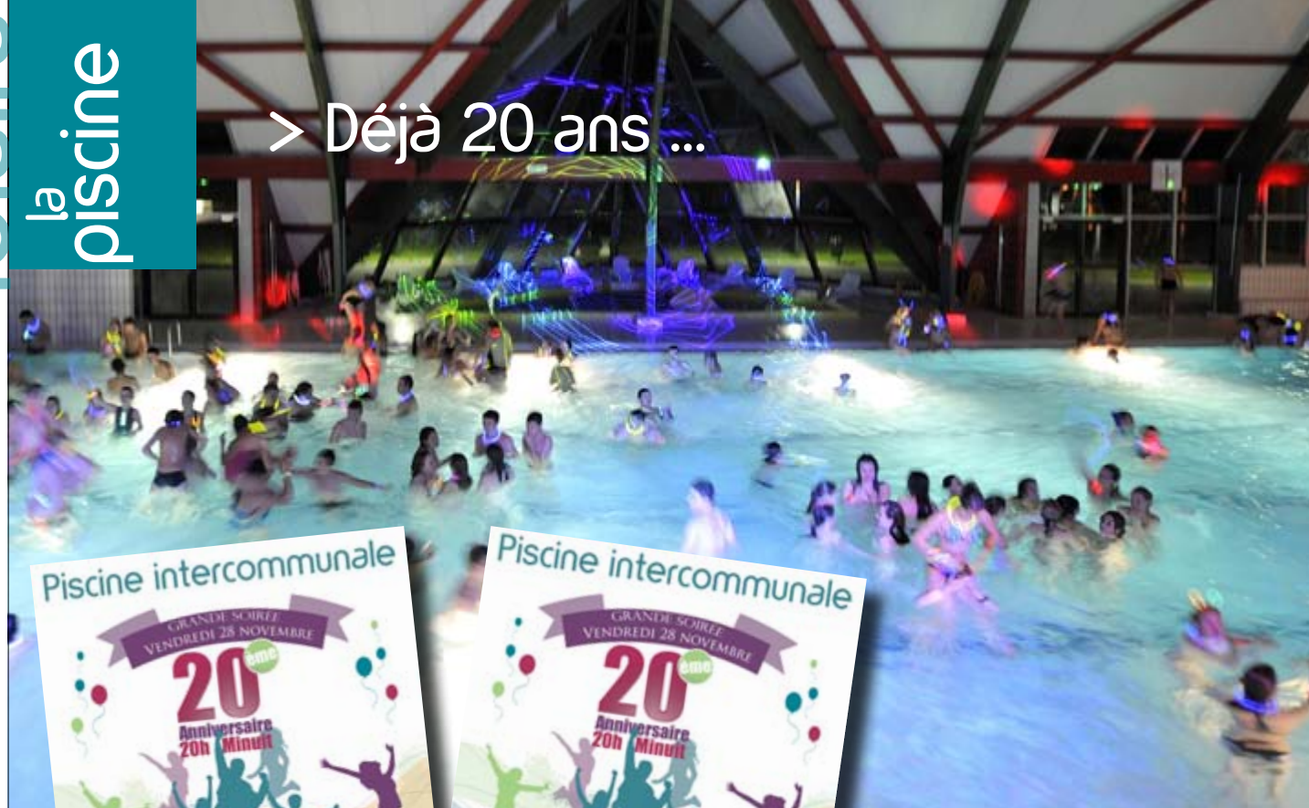
Soirée Fluo en 2014