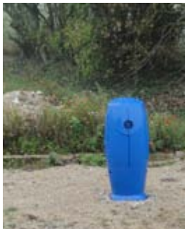
Borne à incendie de réserve

Le château d'eau de la commune ne sera plus utilisé pour la distribution de l'eau potable mais servira de réserve incendie avec le raccordement d'un poteau d'incendie qui se situera Rue de Châlons. L'ancienne réserve incendie située en centre du village a fait l'objet de travaux de remplacement de la dalle de couverture. La défense incendie est donc constituée de ces deux réserves et les anciens poteaux d'incendie ont été retirés. Pour une raison technique de distance entre la réserve et l'extrémité du village, un nouveau poteau a été mis en place Rue de Châlons. La couleur bleue, et non rouge, de ce poteau indique aux pompiers qui seraient amenés à intervenir que ce poteau n'est pas raccordé au réseau public mais à une réserve.