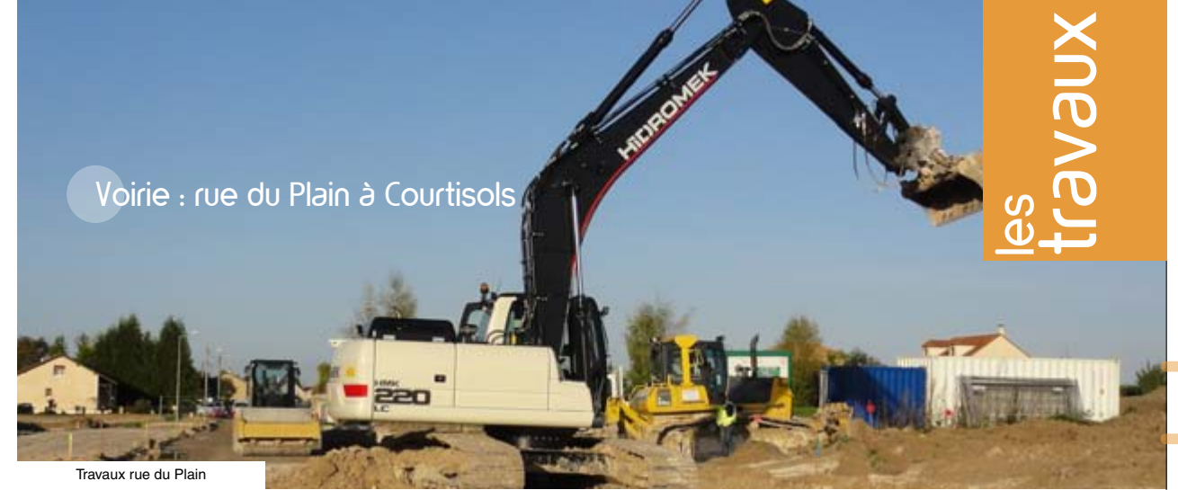
Voirie : rue du Plain à Courtisols