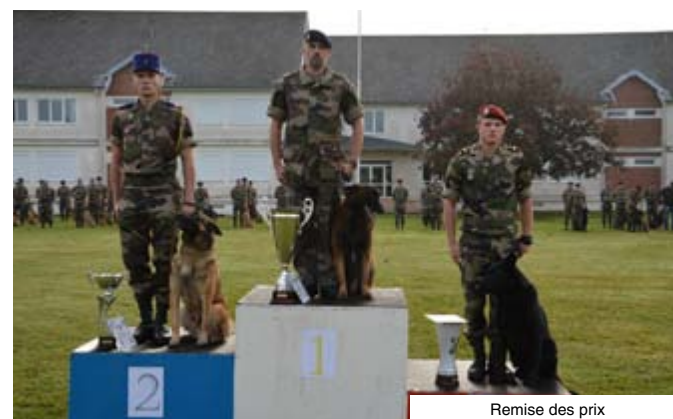
Remise des prix

R egroupant les meilleures équipes cynotechniques des Armées, elle accueillait une centaine de compétiteurs venus s'affronter dans différentes disciplines : épreuve de chien de patrouille, de dressage, de chien d'intervention, chien pisteur et olfaction. Ces disciplines correspondent aux principales missions confiées aux équipes cynotechniques des Armées.