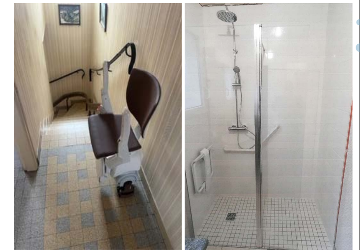
Installation d'un monte-escaliers