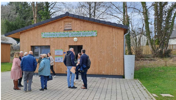
Visite du béguinage de Poix-Terron le 31 mars 2025