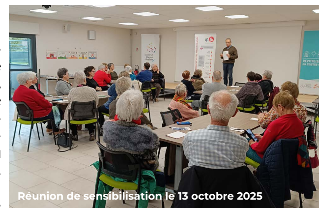
Réunion de sensibilisation le 13 octobre 2025

Un questionnaire en ligne a également permis de recueillir l'avis de personnes n'ayant pu participer aux rencontres.