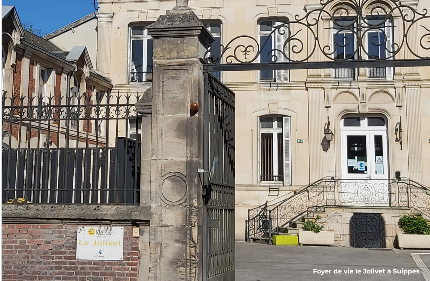
Foyer de vie le Jolivet à Suippes