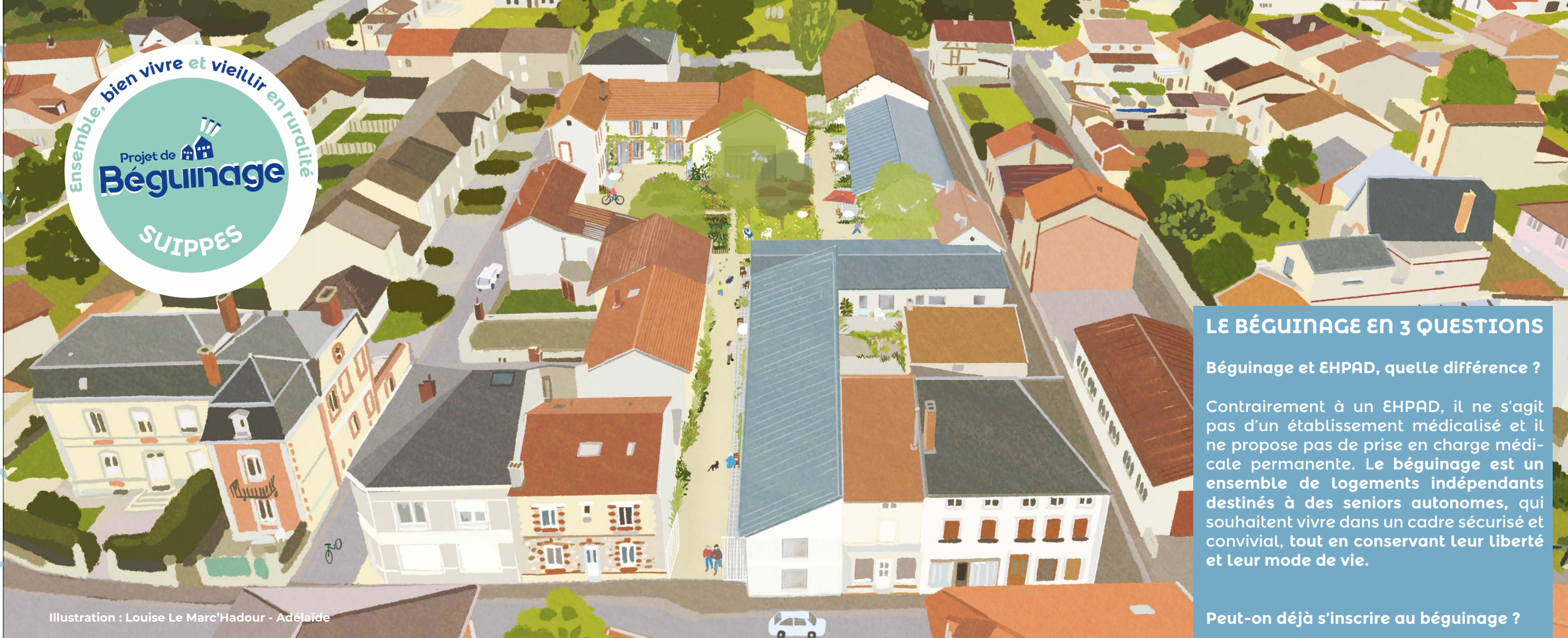
Illustration : Louise Le Marc'Hadour - Adélaïde