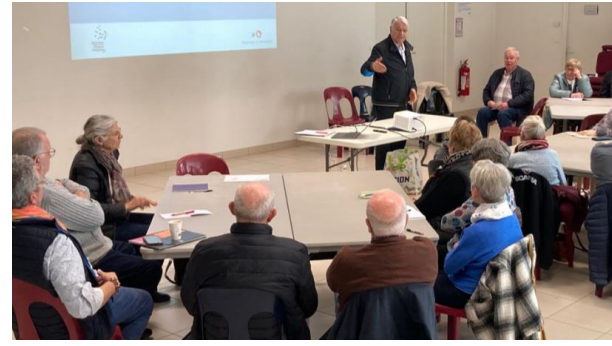
Réunion de co-construction avec les seniors du territoire le 26 mars 2025