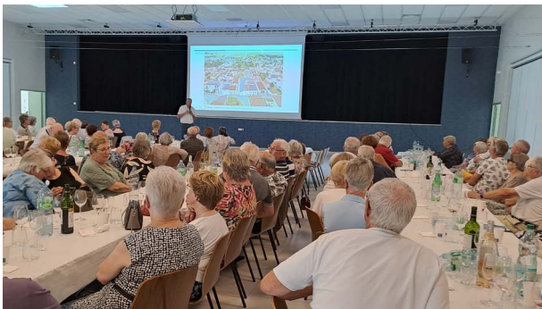
Présentation du projet de béguinage lors de la journée des aînés à Suippes le 25 juin 2025