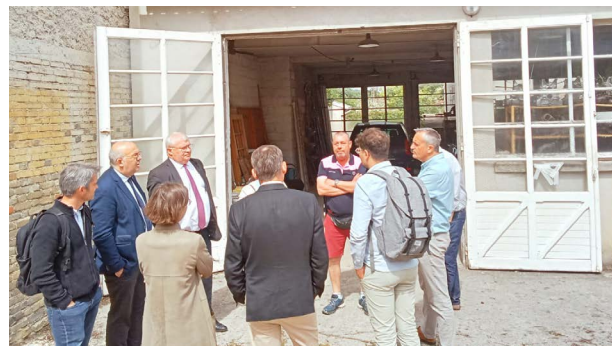
Visite des parlementaires sur le site du projet le 26 mai 2025