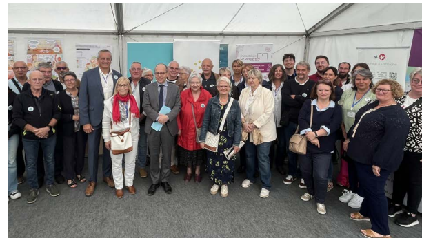
Présentation du projet lors de la Foire de Châlons le 2 septembre 2025