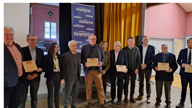
Le projet, lauréat de l'AMI Béguinage de la Région Grand Est, 20 novembre 2025