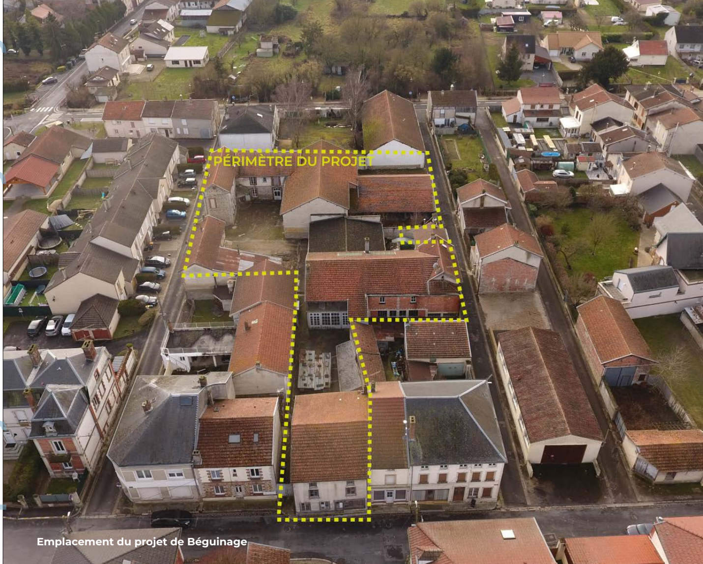
Emplacement du projet de Béguinage