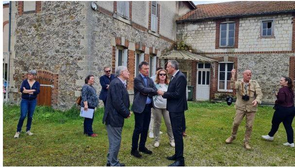
Visite de Franck Leroy, Président de la Région Grand Est sur le site du projet le 12 avril 2024