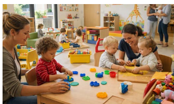
Illustration : Louise Le Marc'Hadour - Adélaïde

À Suippes, un habitat innovant au service des seniors > Dossier p.14-20