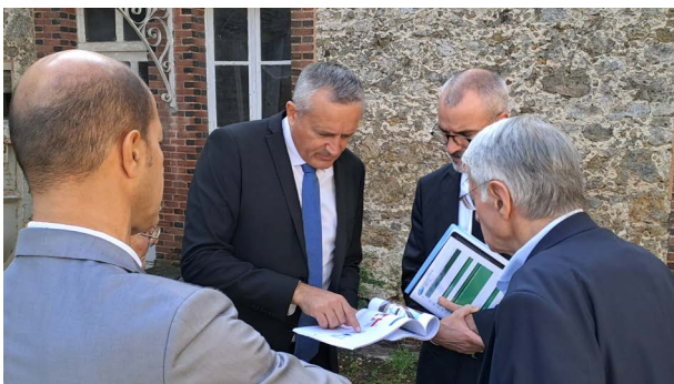
Visite de Romain Royet, Préfet de la Marne, 1er octobre 2025