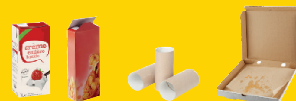
Briques et Emballages en carton

PAPIERS DU QUOTIDIEN ET TOUS LES EMBALLAGES HORS VERRE