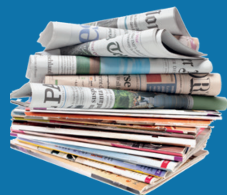
Journaux revues magazines