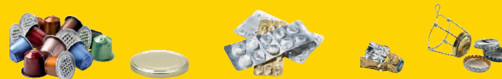
Petits emballages métalliques