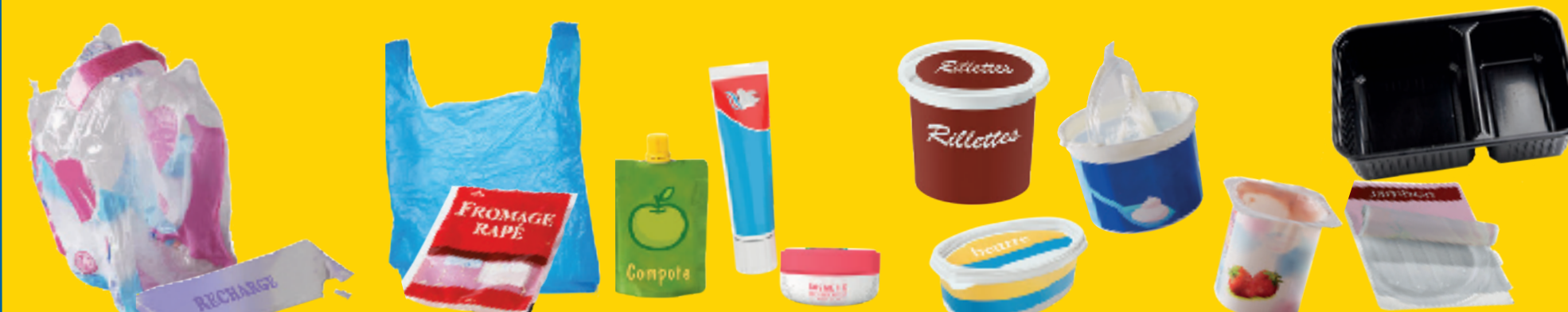
Tous les autres emballages en plastique