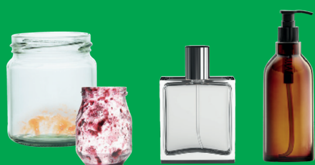
Pots, bocaux et flacons en verre