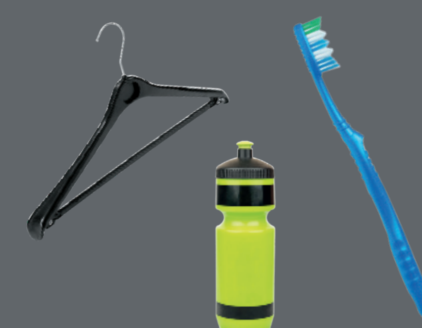
Objets en plastique